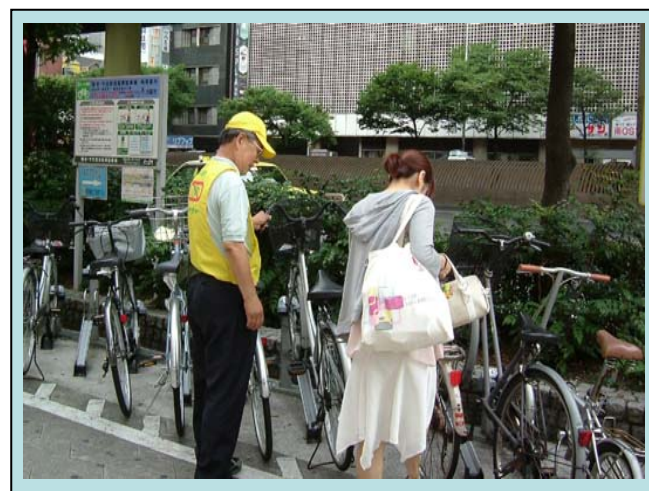
サイクルサポーターの活動