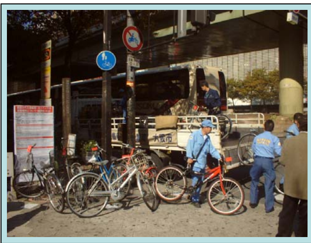
放置自転車の撤去