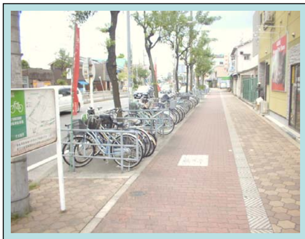
歩道上に設けられた駐輪場 (本市で最も多いタイプ)