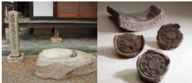
荘厳浄土寺(建物・発掘風景・礎石・出土瓦)。境内は府史跡

えなつのむら たてもの なん 榎津郷の建物。南 北朝時代に戦災で なくなると伝えら れる