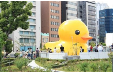
水都大阪2015におけるラバーダック