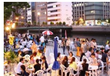
③ 中之島オープンテラス