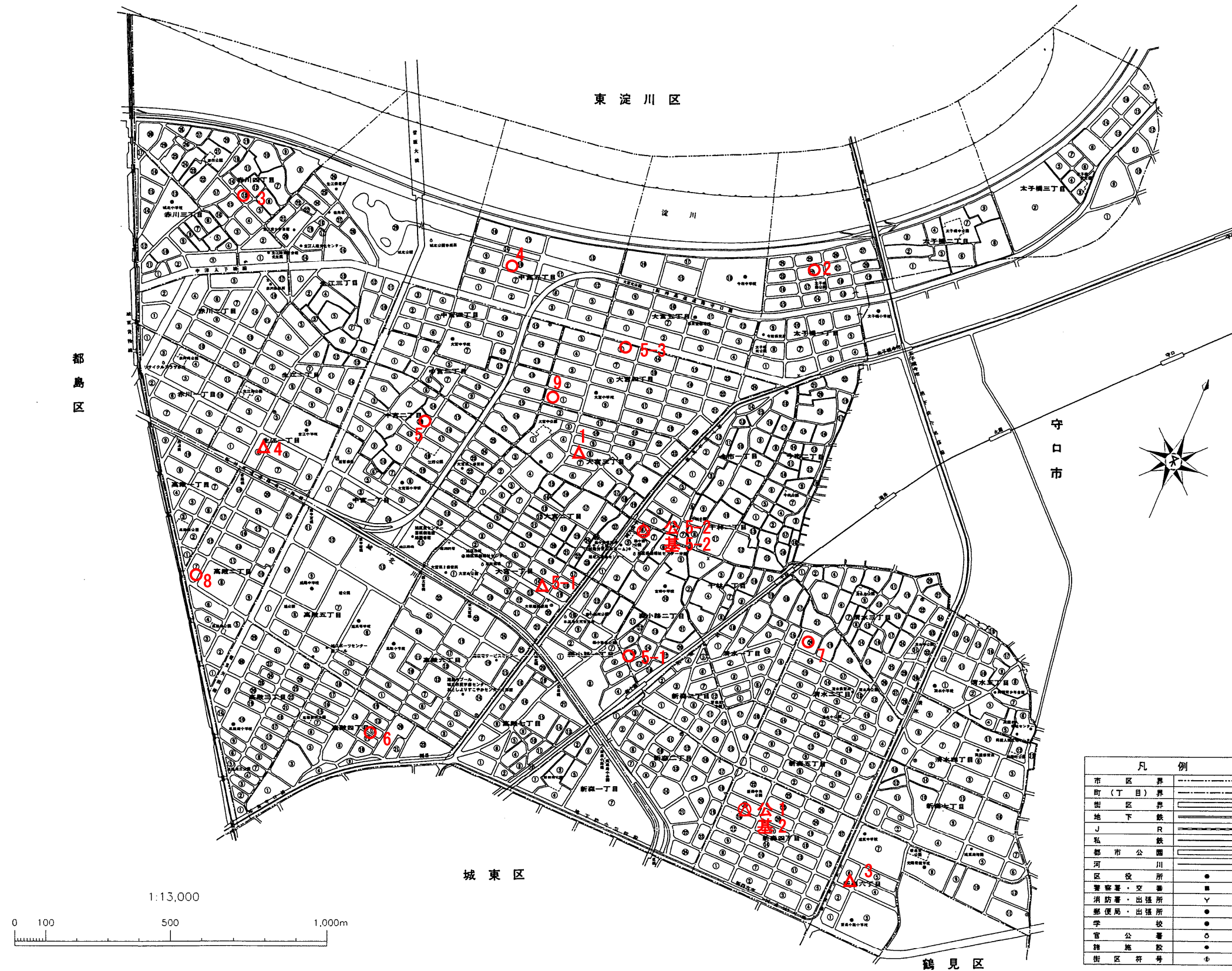
旭区標準地(○)価格表 (平成30年1月1日時点)