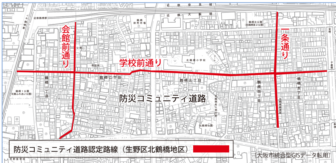
防災コミュニティ道路認定路線 (生野区北鶴橋地区)