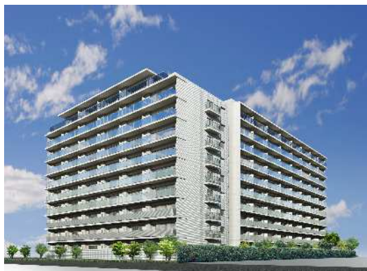
【外観イメージパース】

(計画認定：平成 25 年 3 月 1 日) (変更計画認定：平成 26 年 3 月 10 日) (認定：平成 26 年 3 月 17 日)