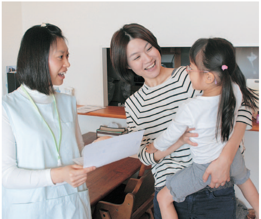
▲いざという時に安心の訪問型病児保育