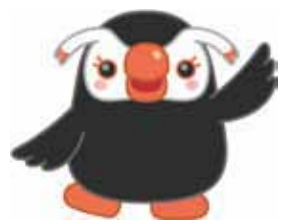
北方領土イメージキャラクター エリカちゃん

北方領土(はっぽうまいぐんとう)は、舞群島・色丹島・国後島・択捉島(えとろふとう)は、わが国固有の領土です。