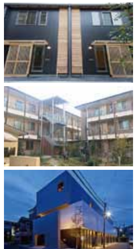
第31回大阪市ハウジングデザイン賞受賞住宅

第31回大阪市ハウジングデザイン賞表彰式にあわせて、次世代への「住み継ぎ」という観点から、住まい・まちの価値をつくる取り組みや、今後の展望についてディスカッションします。定員100人(先着順)。