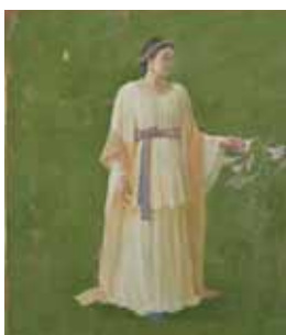
洋画「伊須気余理比売」小瀬一紀(会員・内閣総理大臣賞)

日 2/24(土)~3/25(日) 9:30~17:00(入館は16:30まで)