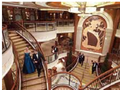
クイーン・エリザベス船内

世界で最も有名な客船「クイーン・エリザベス」の船内見学会。定員各34人。18歳未満は20歳以上同伴。当日、メール会員への登録が必要。