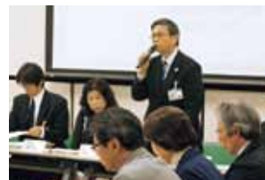
▲区役所で開かれた地活協の意見交換会では、皆さまより貴重なご意見をたくさんいただきました。

「地活協?はい、知ってますよ。もっともっと盛んになるといいですね」と答えてくださる区民の皆さんが少しでも増えることを願っています。