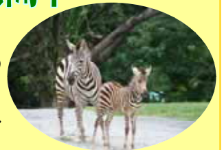
母親「ミカ」と娘「ベル」

天王寺動物園では、8月6日にグランドシマウマの「ベル」が誕生し、アフリカサバンナゾーンで一般公開しています。