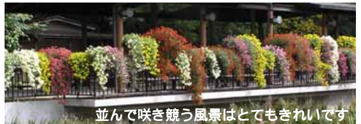
並んで咲き競う風景はとてもきれいです

ちなみに一季咲きの品種では年間通して肥料が多いと咲かないことがあるので注意しましょう。