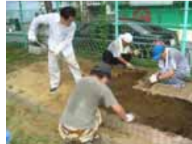
花壇づくりに奮闘する「なかよし会」の皆さん

地域住民の中から花壇もあればいいなと声があがり、愛護会の中で話し合い、より地域に愛される公園にし