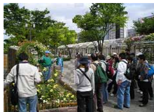
天王寺公園ローズツアー

平成18年に開催された「世界バラ会議大阪大会2006」を契機として、市民の皆さんにバラをもっと身近に感じ、愛していただくためにスタートしたローズツアー。