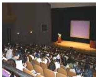
緑化リーダー第1回講習会

の方が、約10ヶ月にわたる講習を終了し、10月23日(木)には、新しい大阪の“はなびと”として、認証式が行われる予定となっています。