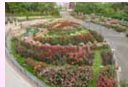
鶴見緑地ばら園の風景