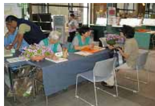
9/2「北区バラの会」の皆さんと一緒に行った北区役所での緑化相談