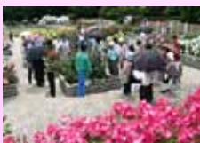
長居植物園ローズツアー