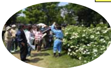
鞆公園ローズツアー

大阪市内のバラの名所として市民の皆さんに親しまれている鞆公園(西区)、長居植物園(東住吉区)、花博記念公園鶴見緑地(鶴見区)、天王寺公園(天王寺区)では、秋バラの見頃にあわせ、それぞれのバラ園でローズツアーを開催します。