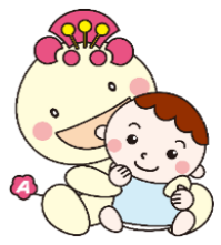
区マスコットキャラクター あべのん