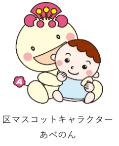
区マスコットキャラクター あべのん