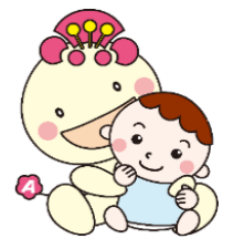
区マスコットキャラクター あべのん