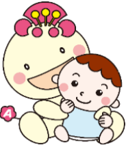
区マスコットキャラクター あべのん