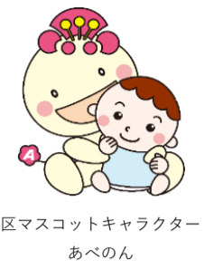
区マスコットキャラクター あべのん