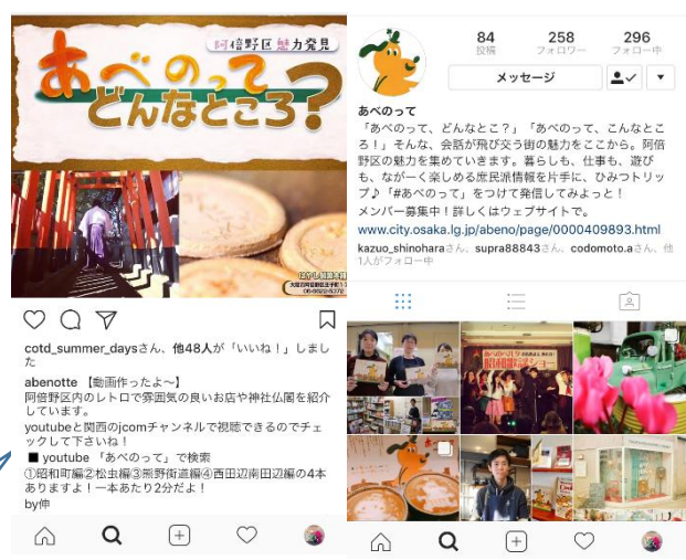
フェイスブック「あべのって」で阿倍野区の魅力を発信しています！