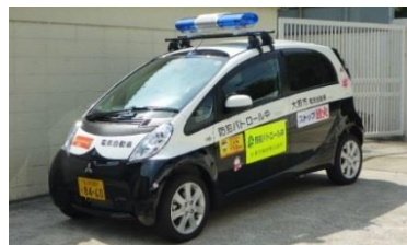
青色防犯パトロール車