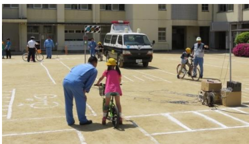
保育園・幼稚園児や小学校児童を対象にした交通安全教室