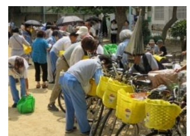
自転車マナーアップ 街頭キャンペーン

阿倍野区では、「自転車前かご用ひったくり防止カバー・自転車盗難防止ワイヤー錠の無料取付キャンペーン」を毎月1回程度、地域の集会所・公園等で行っています。