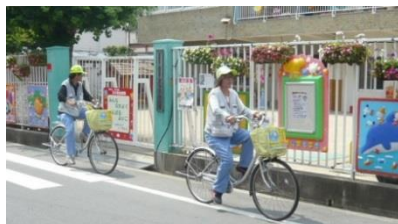
自転車での見守り活動

阿倍野区では、区役所職員による「地域みまもり隊」が自転車・青色防犯パトロール車で通学路を中心とした巡回パトロールを日々行っています。