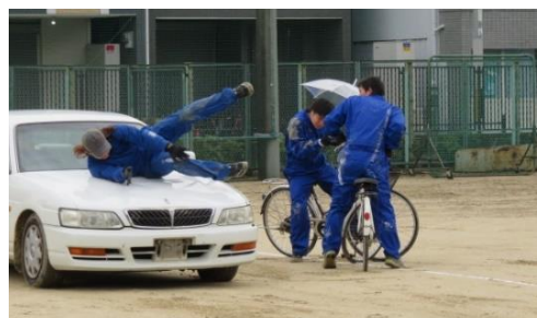
中学生を対象にしたスケアード・ストレート方式(※)による交通安全教育