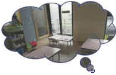
ランチルームで おやつや給食を頂きます