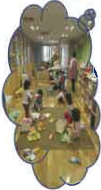
先生の手作り人形でおままごと