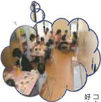
好きな遊びを選びます。 ままごと、ブロック