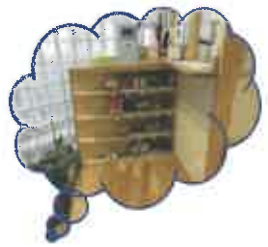
可愛い靴の並び靴箱