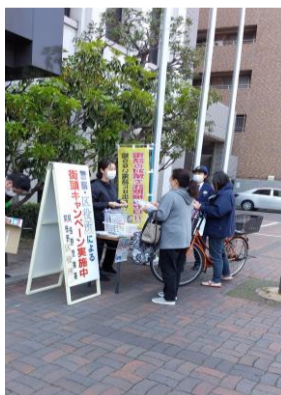
春の全国交通安全運動啓発の様子