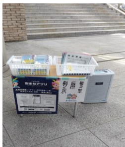
特殊詐欺被害について啓発している様子