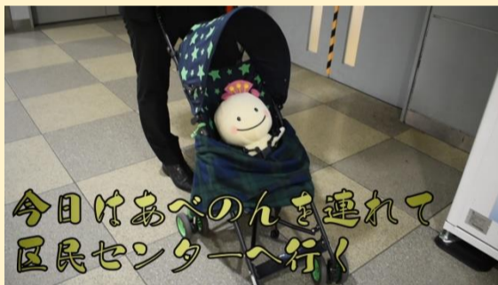
バリアフリーマップ広報用動画