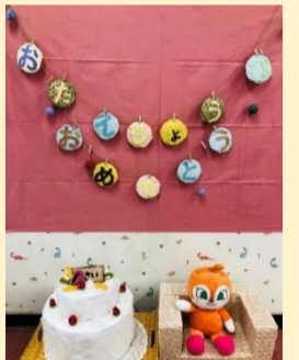
子育て情報コーナー

区役所1階の「子育て情報コーナー」は、平日9時～17時半まで開放しており、手続き等で来所された保護者やお子さんの休憩・授乳にたくさんの方がご利用されています。体重計、身長計も置いており、保健師にお声がけいただければ、計測のお手伝いや、育児相談にも対応します。