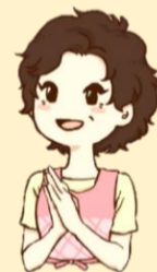
阿倍野区子育て相談キャラクター もも さん

母子健康手帳発行時には「パパと子手帳」も配布しており、お父さん、パートナーの方も含めた家族丸ごとの支援をめざしています。 ＜保健活動担当＞