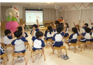
防犯紙芝居「まもるくとあべのん」のお話の様子