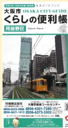
くらしの便利帳表紙

ほかにも情報がたくさん掲載されています。区役所で無料で配布しておりますのでぜひお越しください。また、点字版・音訳版もありますのでお問合せください。 <区政企画担当>