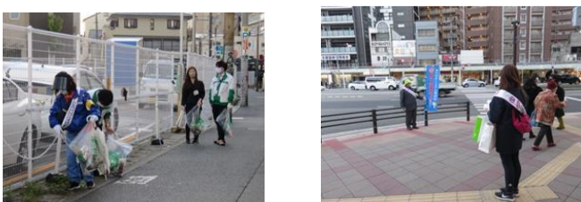
路上喫煙 啓発活動の様子