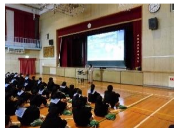
阪南中学校1年生防災研修