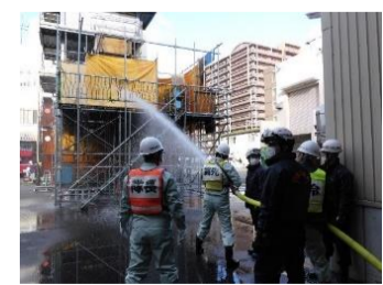
地域防災リーダー可搬式ポンプ放水訓練