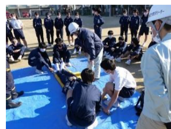
阪南中学校2年生簡易担架作成訓練