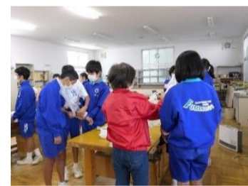
文の里中学校応急処置訓練