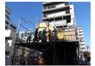
地域防災リーダー高所救助訓練