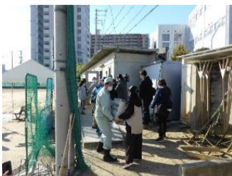
文の里中学校内備蓄倉庫点検