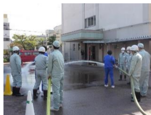
阿倍野中学校2年生可搬式ポンプ放水訓練