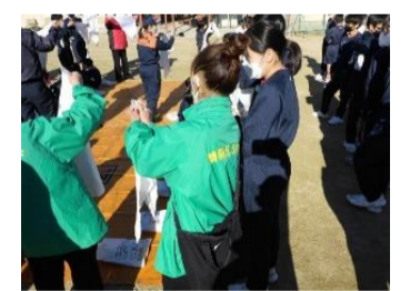
阪南中学校2年生応急処置訓練