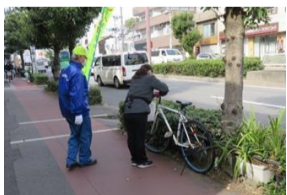
放置自転車啓発活動の様子