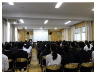
阿倍野中学校1年生防災研修