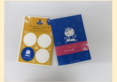
おさんぽマップイメージ