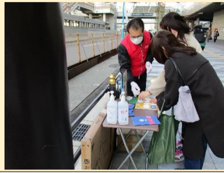
スタンプポイントでスタンプを！