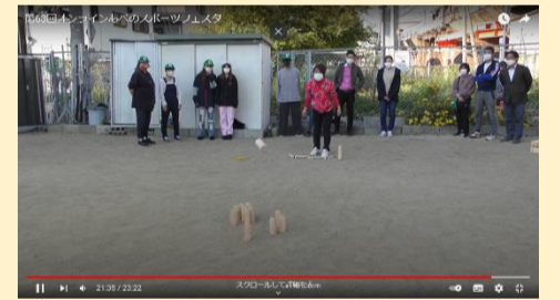
動画配信イメージ