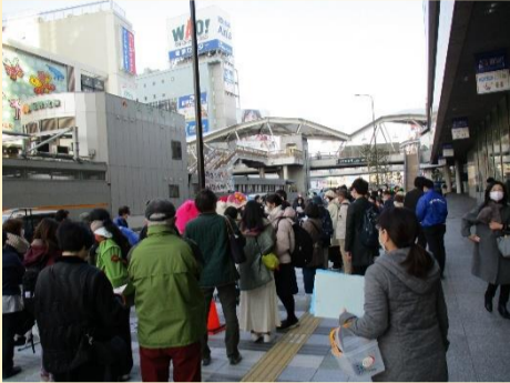
おさんぽイベントの参加者のみなさん