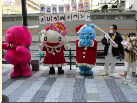
おさんぽイベントに勢ぞろい！