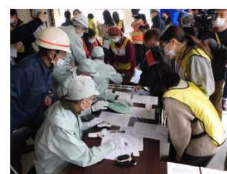
外国人避難所受付訓練の様子