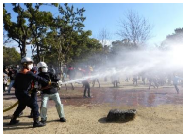
貯水槽を使った放水訓練の様子