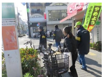
放置自転車 啓発活動の様子