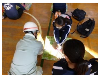
防災リーダー指導による訓練