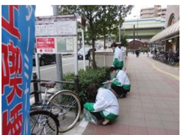
路上喫煙 啓発活動の様子