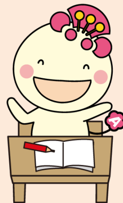
阿倍野区マスコットキャラクター あべのん