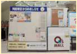
あべのキューズモール

公園や小・中学校の近く、駅の中、商業施設などにあります。区の行政情報や楽しいイベント告知など、まちかどから発信しています。あなたのお家の近くにもあるかも…。ぜひ探してみてください!