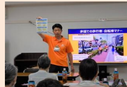
【園児対象交通安全出前講座】【地域住民対象交通安全出前講座】