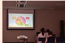
【食育祭ミニセミナーの様子】