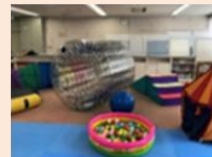
【親子の居場所「あべのん」の様子】