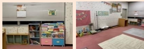
【子育て情報コーナーの様子】

・妊娠期から子育て期までの切れ目ない相談支援を充実させるため、周産期ケアや母体管理の専門家である助産師による専門相談を行います。 ・発達に課題のあるこどもと保護者が速やかに診断・医療につながるよう、臨床心理士等による継続的な専門相談を行うとともに、保育施設や幼稚園との連携を図ります。