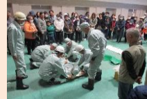
【まちなか防災訓練】