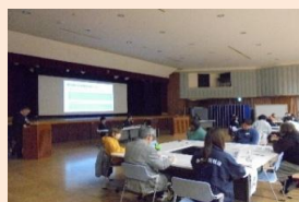
【地域福祉ミーティングの様子】