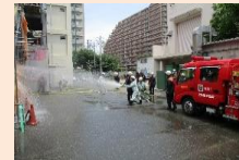
【地域防災リーダー訓練】