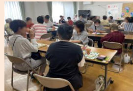
【ふれあい喫茶の様子】