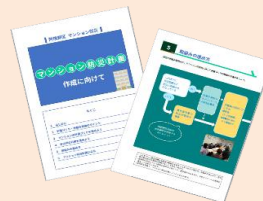
【マンション防災計画作成リーフレット】