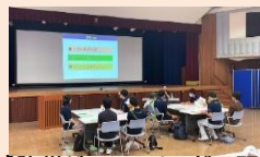
【防災ジュニアリーダー研修】