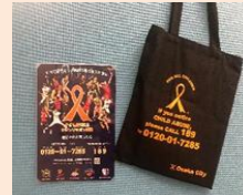
【児童虐待防止月間の取組の様子】 【児童虐待防止啓発ビラと啓発物品】