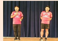
【あべのウォーク(セレッソ大阪コラボ)】