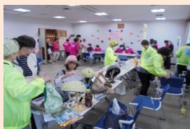
【つながりフェスタの様子】