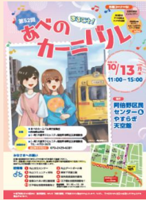
【あべのカーニバルのポスター】