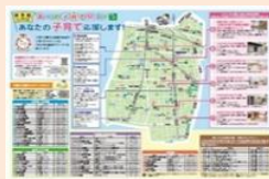
【あべの子育てマップ】