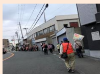
【あべのウォークの様子】