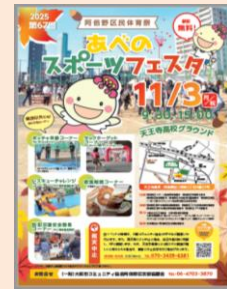
【あべのスポーツフェスタのポスター】