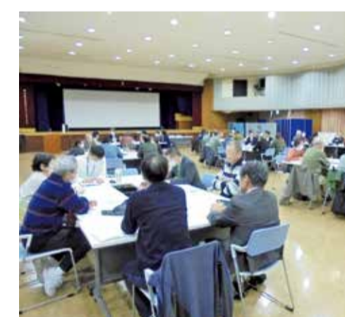
地域福祉ミーティング

「気にかける・つながる・支えあう地域づくり」、「誰でも、いつでも、なんでもと言える相談支援体制づくり」を基本目標に、引き続き地域にかかわるすべての人や団体等が、誰もが幸せに暮らせるまちをめざして連携・協働して、環境の変化に応じた地域福祉活動に取り組むとともに、地域の包括的な相談支援体制の充実に努めます。複合的な課題を有する人や世帯の的確に対応するため、関係する事業者や支援者同士の連携を強化するとともに、総合的な支援調整の場(つながる場)や支援会議の仕組み等を活用し、適切な支援につなげていきます。