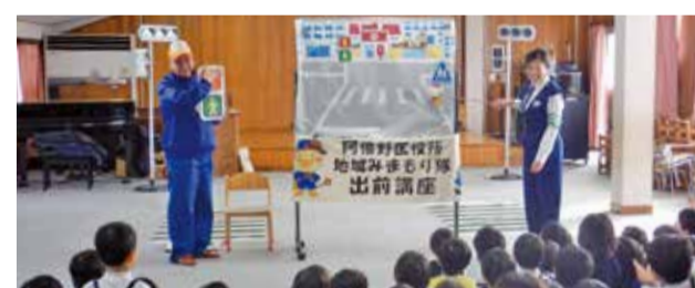
出前講座(学校・園)

区内外から人が集い、にぎわいあふれるまちづくりを進めるため、区内にある都市景観資源等を「あべのdakara(宝)」*として積極的にアピールするなど、誰もが自慢しなくなる魅力情報の発信に努めるとともに、区内全域の回遊性を高めます。さらに、地域団体や企業等が主催するイベント等を支援し、地域と共にまちのにぎわいづくりに取り組みます。 *景観資源や商店街などの魅力資源、魅力あるお店や商品、区内外に誇れる企業などを、あべのお宝という意味を込めた「あべのdakara(宝)」と命名