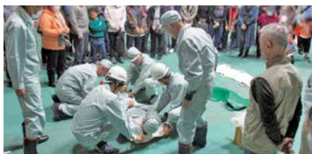
まちなか防災訓練

自助・共助などを通じた防災・減災の仕組みづくりとして、区民一人ひとりが家庭内備蓄など日ごろの備えに加え、地域特性に応じた地域の自主的な防災の取組が実施できるよう支援するとともに、若年者層への防災意識向上に向けた取組を着実に実施します。また、SNSの活用等新たな情報伝達手段の拡充を図り、災害に強いまちづくりを推進します。