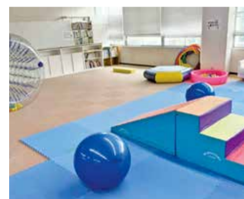
親子の居場所「ぴああべのん」

引き続き、多様化する子育て世代のニーズに対応した各種事業を継続して実施します。また、児童虐待や不登校など悩みを抱える保護者や子どもたちに対し、専門技術や知識を有する職員を配置して相談体制を充実するとともに、教育と福祉との連携等、関係機関と連携しながら効果的な支援に努めます。