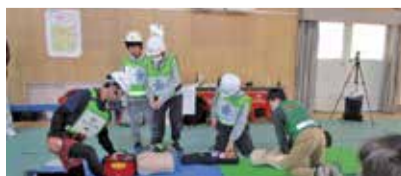
まちなか防災訓練での様子