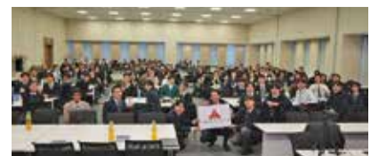
全国高校生未来会議