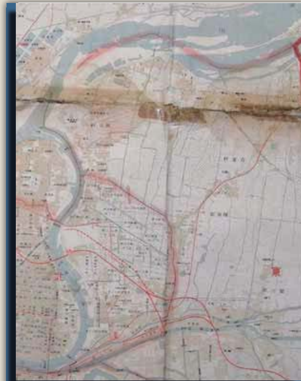
地図■大正 14 年 (1925) の旭区周辺