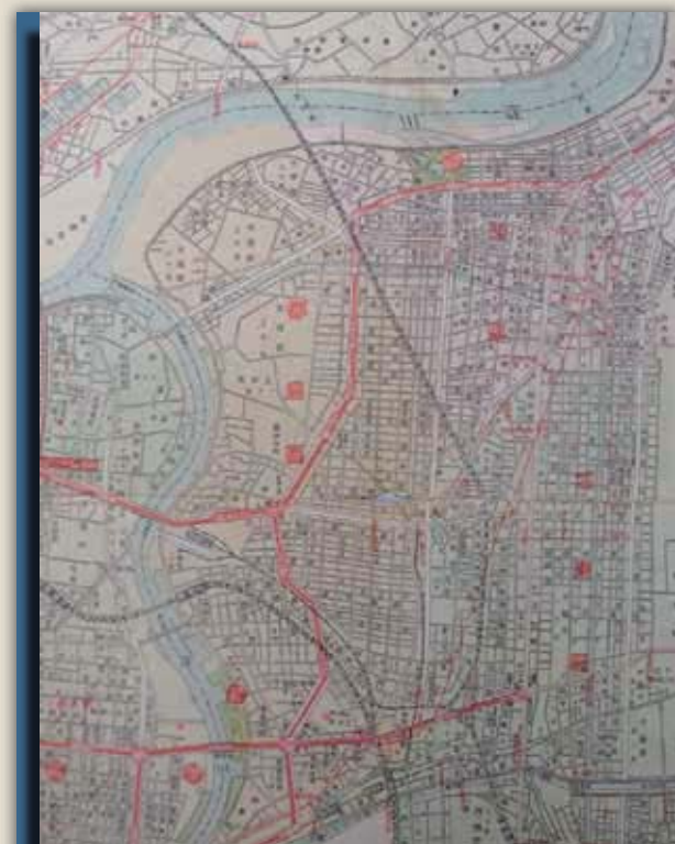
地図■昭和 29 年 (1954) の旭区周辺