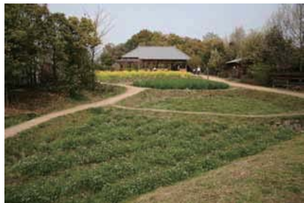
写真■田園より母屋を臨む

されている。昭和初期から経済成長黎明期ごろまでの清水・新森地域は、田畑の中に集合住宅が建ち並ぶ状況で、特に現在の内環状線から東には、一面に稲田や蓮田が水路とともに広がっていた。自然体験観察園では、昔日の清水・新森地域の風景と農家の暮らしむきなど当時の様子が偲ばれる。