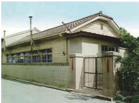
写真■新森小路幼稚園（本園）

昭和61年（1986）分園が鉄骨耐火構造3階建てに改築されるとともに本園が閉園となり、現在に至っている。