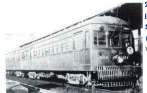
写真■昭和2年(1927)登場の1550型車両(ロマンスカー)

京阪間を100分で走らせる予定が5時間もかかる始末、そのためか(或いは乗客誘致のPRのためのサービスか)開業から3日間は運賃半額サービスで人気挽回を図った。しかし、開業直後の不祥事はその後の乗客数の伸びにも影響した。