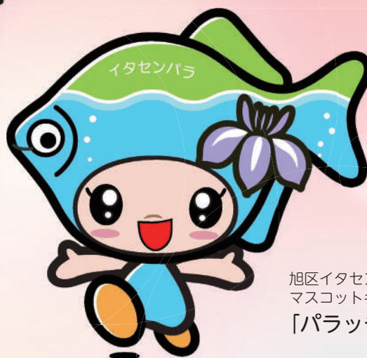
旭区イタセンパラ マスコットキャラクター 「パラッチ」