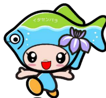
旭区イタセンパラ マスコット キャラクター 「パラッチ」