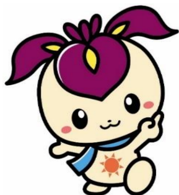
旭区マスコット キャラクター 「しょうぶちゃん」