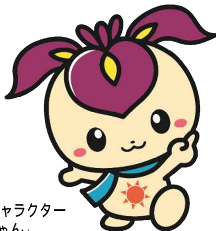
旭区マスコットキャラクター 「しょうぶちゃん」