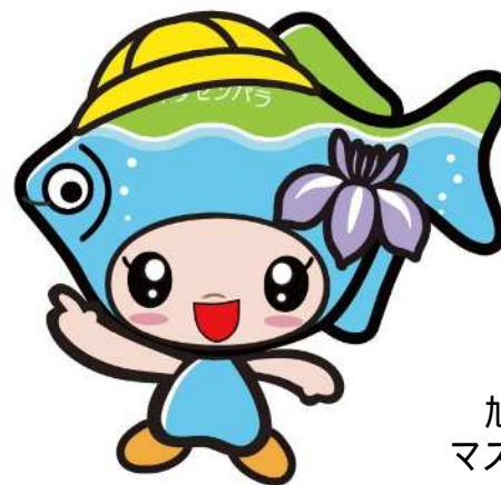
旭区イタセンパラ マスコットキャラクター 「パラッチ」