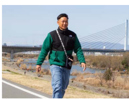
河川敷を走るの、とても気持ちが良いのでオススメです！

このまちで学生生活をスタートされる人にとっては、充実した毎日を送れると思うので、とてもオススメです！