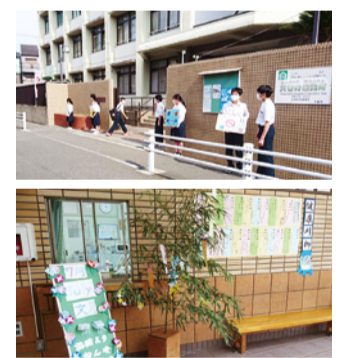
登校時のあいさつ運動(上) 生徒会・部活動の取組(下)

昨年度からのコロナ禍においても、子どもたちの安心・安全を第一に一人ひとりを大切にする教育を進めています。また、子どもたちの良い面、良い行動を積極的に評価し、伸ばす教育を進める「エビデンスベースの学校改革」の取組として、PBS=ポジティブ行動支援を導入。その他にもICTを活用した教育の一環で、タッチ