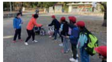
全校児童が参加の「なかよしフェスタ」の様子