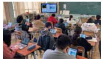
タブレット端末を活用した学習の様子