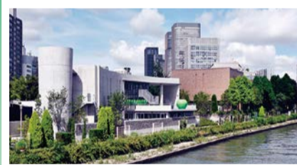
第40回大阪市長賞:こども本の森 中之島 撮影者:安藤忠雄建築研究所

周辺景観の向上に資し、かつ景観上優れた建物やまちなみを推薦していただき、特に優れたものを表彰します。