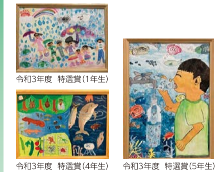
令和3年度 特選賞(1年生) 令和3年度 特選賞(4年生) 令和3年度 特選賞(5年生)