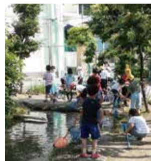
朝のビオトープはとてにぎやかです

毎朝、地域の方がビオトープと子どもたちのお世話をしてくださっています。特に低学年はビオトープにある池でザリガニを釣ったり、メダカをとったりして身近な自然に親しむことが大好きです(たまに池に落ちてびしょぬれになる子どももいますが...)。このビオトープで生物や自然が大好きになり、北海道の「北の大地の水族館」で単身、飼育員として勤めている先輩もいます(働きぶりを取材され、テレビの情報番組で紹介されていました)。