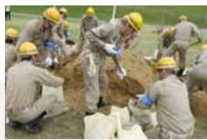
浸水被害を防ぐための土のう作りを実施

Q 水防団って? A 水防法に基づき自治体などが設置する地域住民の防災組織です。水防団の構成員は、普段はそれぞれの地域で生活している民間の方々ですが、非常時には水防団員として出動します。淀川左岸水防事務組合は、55区域の水防分団で構成されており、多くの団員が水防活動に従事しています。