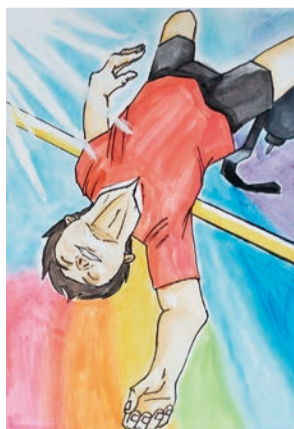
令和4年度 障がい者週間のポスター 小学生部門 最優秀賞作品