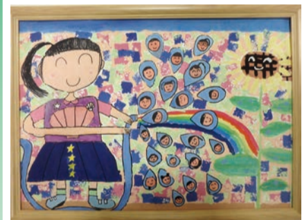
令和4年度 特選賞(2年生)