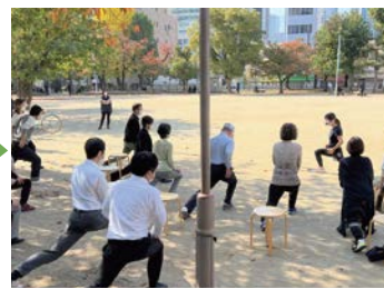
お昼休み☆20分ゆるゆるストレッチ