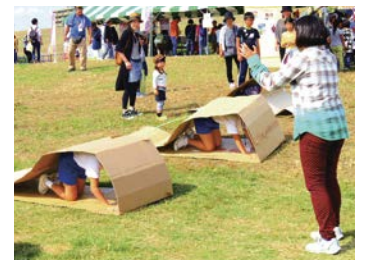
ダンボールキャタピラー

問い合わせ▶建設局調整課 ☎06-6615-6704 FAX06-6615-6070