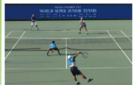
提供：関西テニス協会

①大阪市長杯2023世界スーパージュニアテニス選手権大会観戦チケット ②テニスクリニック