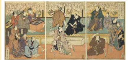
浪花道頓堀大歌舞伎舞台惣稽古之図(南木コレクション) (大阪城天守閣蔵)

が訪れた大坂三郷の景観を紹介します。 日 10/4(水)まで9:00～17:00(入館は16:30まで) ¥ 入館料：大人600円 場 問 大阪城天守閣 ☎06-6941-3044 FAX06-6941-2197