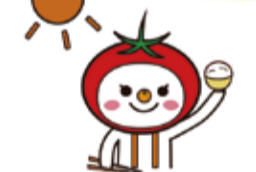
▲大阪市食育推進キャラクター「たべやん」