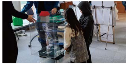
模型による体験の様子

日 10/21(土)・22(日) 10:00～12:00、13:00～15:00 場 下水道科学館 問 建設局調整課 ☎06-6615-6433 FAX06-6615-7690