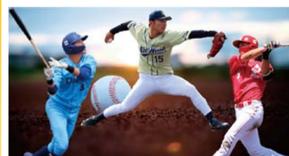
大阪ガス、NTT西日本、日本生命の野球部