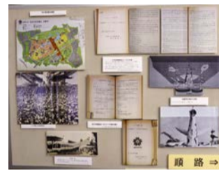
過去の展示の様子

市の歴史や市政に関する理解を深めていただくため、明治から昭和初期に市が主催・後援した博覧会と市の近代都市化について、所蔵する公文書と刊行物を通じて紹介します。ぜひご来館ください。