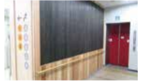
掲示板・誘導サイン(1階)