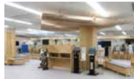
窓口サービス課(1階)

来庁される方々に、木のやさしさやあたたかさを感じていただき、安心して住みよい旭区を肌で感じていただけるよう、区役所の総合案内及び1階西側の待合スペースにおいて、国産木材を取り入れた整備を行うとともに、待合スペースを拡張するなどのレイアウト変更を行いました。また、庁舎全体の案内サインをより分かりやすくし、随所に国産木材を活用しています。引き続き、快適に安心して利用いただける区役所をめざし、取り組んで参ります。