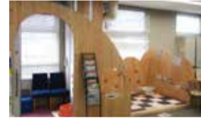
キッズコーナー(2階)