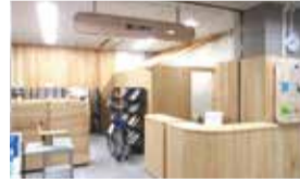
窓口案内・区民情報コーナー(1階)