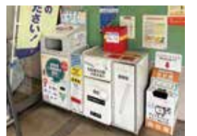
▲区役所内の蛍光灯、小型家電や電池などの回収ボックス