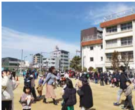
▲昨年の「清水フェスティバル」の様子