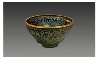
国宝 油滴天目茶碗 南宋時代・12-13世紀 建築 大阪市立東洋陶磁美術館 (住友グループ寄贈/安宅コレクション)