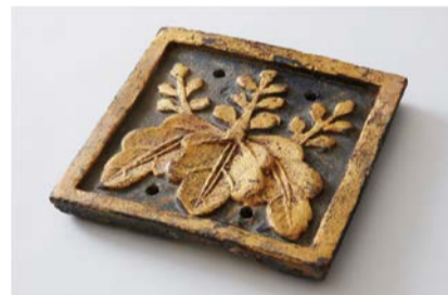
金箔桐文方形飾瓦 大阪市指定文化財 豊田時代 大阪歴史博物館保管

豊臣秀吉が造った大坂城を象徴する金箔瓦や武家屋敷の屋根を飾った家紋瓦などの発掘資料を展示し、大坂城と城下町の姿を紹介します。