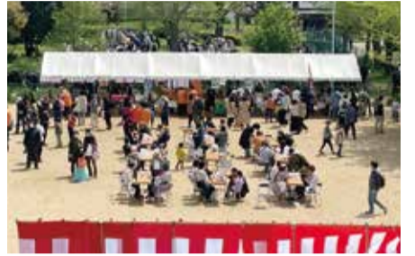
▲昨年の「太子橋さくらまつり」の様子

問合せ 太子橋校下地域活動協議会(太子橋2-7-19) ☎06-6957-2077 [(月)~(金) 10:00~13:00]