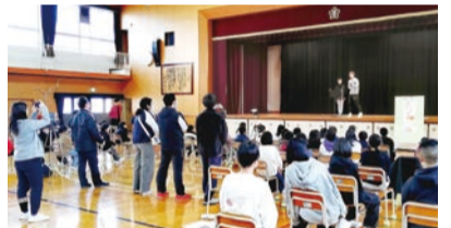
生江小学校での様子