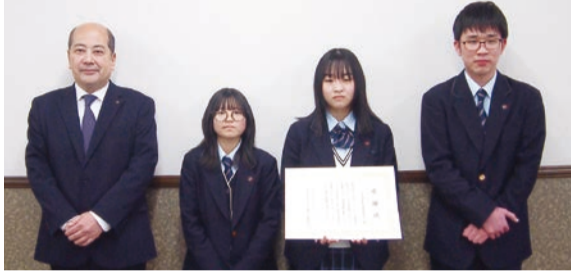
東洋学園高等専修学校

区内イベントへの参画、婚姻届のデザイン提案、地域清掃活動によるまちの美化推進に取り組む等、区政の推進に大きく尽力。