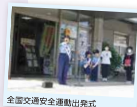
全国交通安全運動出発式