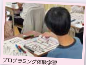
プログラミング体験学習