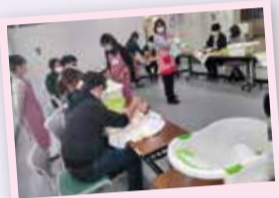
プレパパマレッスン