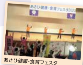
あさひ健康・食育フェスタ