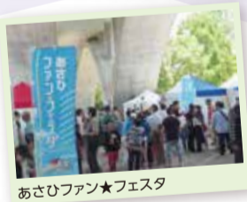
あさひファン★フェスタ