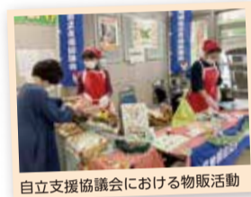
自立支援協議会における物販活動