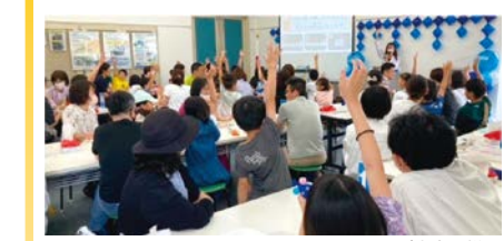
クイズ大会の様子

小学生を対象に、水に関するワークショップや体験型のイベント、謎解きなどを開催。定員各回70人。 ⑥ 6/15(土)・16(日)各日10:00～