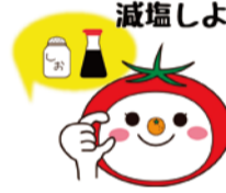
大阪市食育推進キャラクター「たべやん」

食塩の摂りすぎは循環器疾患やがんとの関連が大きいといわれています。高血圧など生活習慣病予防のために、普段の食生活を見直し、できることから始めてみましょう。簡単な減塩のコツなど詳しくはHPをご覧ください。