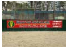
▲ニッター・プレイフィールド旭